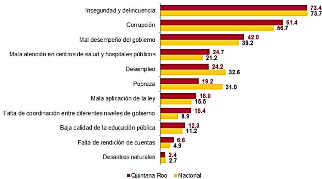
Percepción sobre problemas más importantes en su entidad federativa

Según el INEGI, en Quintana Roo, un 61.4% de la población de 18 años y más refirió que la corrupción es el segundo problema más importante del estado (2018, pág. 41), muy por encima del desempleo, pobreza, o educación pública (Ver Grafica 1). Así mismo, 93% de la población de 18 años y más percibió que los actos de corrupción en su entidad son muy frecuentes o frecuentes, percepción que está ligeramente sobre el índice nacional