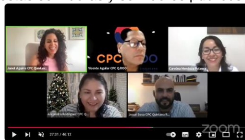
Sesión Ordinaria 16 del CPC Periodo 2024-2025 Comite de Participación Ciu... 22 suscriptores